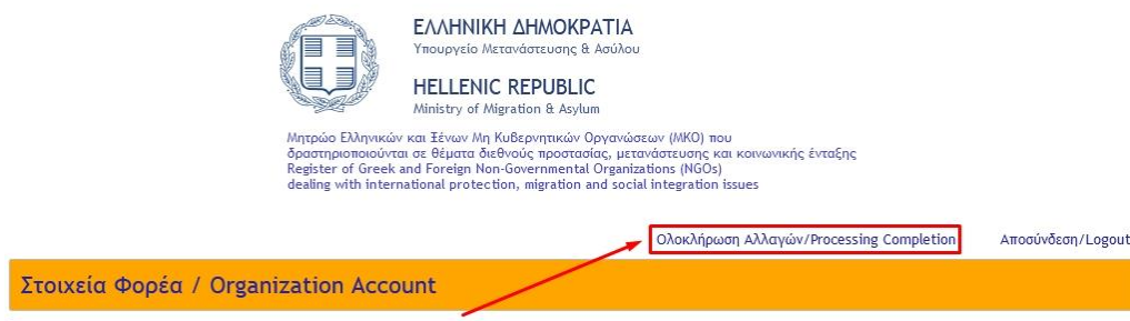
Εικόνα 9: Σύνδεσμος «Ολοκλήρωση Αλλαγών/Processing Completion».

Η αποθήκευση των ενημερωμένων στοιχείων, πραγματοποιείται με κλικ στο κουμπί « Αποθήκευση » κάτω από τις αντίστοιχες φόρμες που πραγματοποιήθηκαν αλλαγές, ενώ η ενημέρωση της υπηρεσίας για την ολοκλήρωση των αλλαγών και το κλείδωμα του λογαριασμού πραγματοποιείται με κλικ στον σύνδεσμο « Ολοκλήρωση Αλλαγών/Processing Completion », ο οποίος βρίσκεται στο άνω δεξιά τμήμα της σελίδας, όπως απεικονίζεται στην Εικόνα 9.