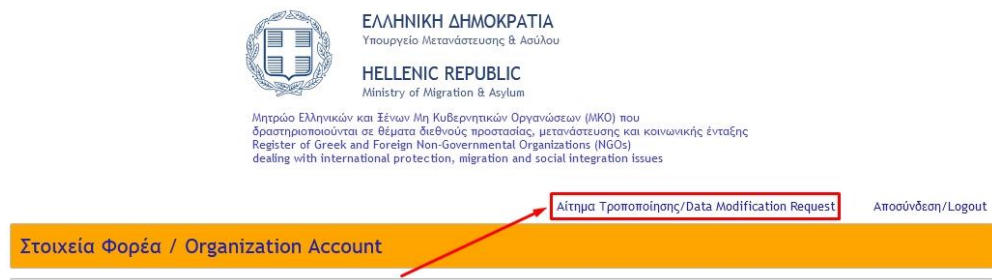
Εικόνα 8: Σύνδεσμος «Αίτημα Τροποποίησης/Data Modification Request».

Μετά την Α΄ Φάση Εγγραφής, οποτεδήποτε απαιτείται, η ΜΚΟ δύναται να αιτηθεί την τροποποίηση των υποβληθέντων στοιχείων, αποστέλλοντας ένα « Αίτημα Τροποποίησης/Data Modification Request ». Αυτό μπορεί να γίνει μέσω του ομώνυμου συνδέσμου, ο οποίος βρίσκεται στο άνω δεξιά τμήμα της σελίδας, όπως απεικονίζεται στην Εικόνα 8.